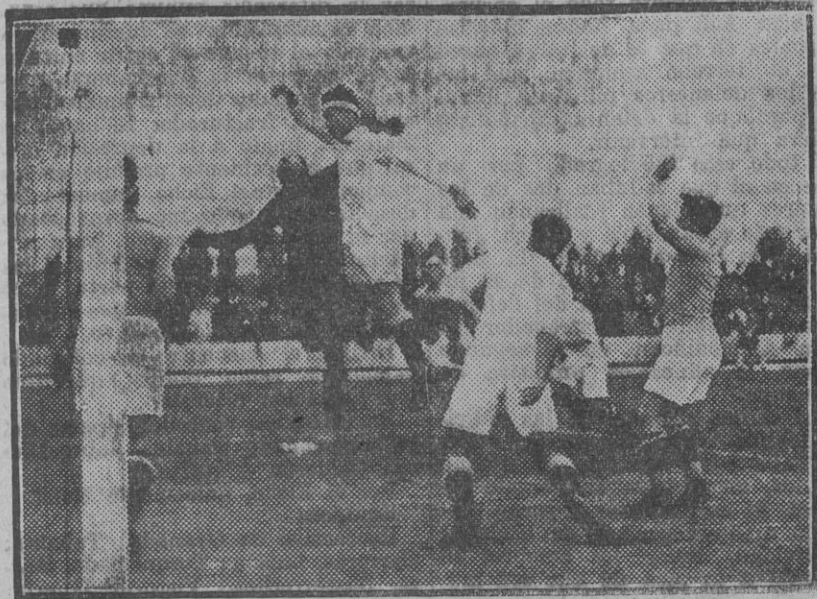
Uno de los innumerables momentos de apuro por que pasó la puerta asturiana.