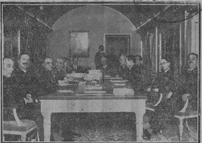
MADRID.—Reanudación de las negociaciones comerciales francoespañolas en el ministerio de Estado.

La campaña emprendida por el ex ministro de Hacienda señor Churchill contra el Gobierno de Unión Nacional, y más especialmente contra el señor Macdonald comienza a dar sus frutos, y se cree que está a punto de producirse una honda división en el seno del partido conservador.