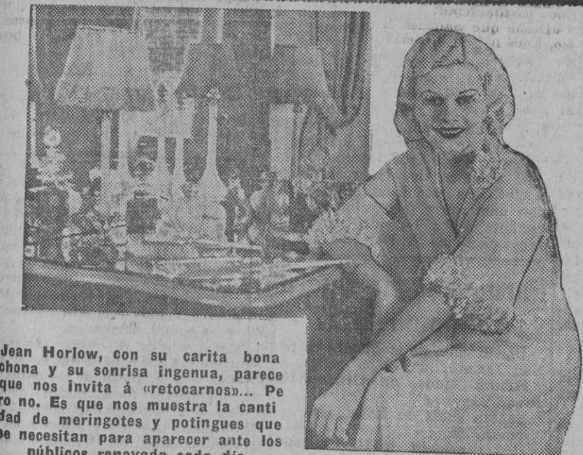
Jean Harlow, con su carita bonachona y su sonrisa ingenua, parece que nos invita a «retocarnos»... Pero no. Es que nos muestra la cantidad de meringotes y potingues que se necesitan para aparecer ante los públicos renovada cada día.

La encuesta sorprendió también por su inesperado resultado en las filas masculinas. Los empresarios teatrales escogieron, en orden de importancia, a: Clark Gable, Will Rogers, Wallace Berry, Bing Crosby y George Arliss.