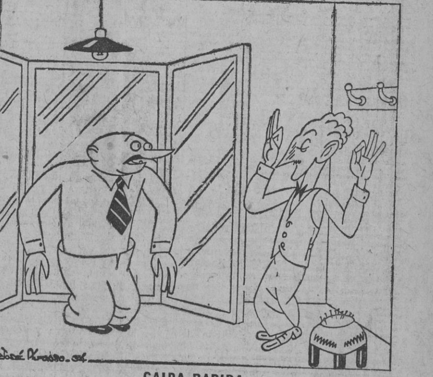
CAIDA RAPIDA —No me lo niegue. Ese pantalón le cae a usted admirablemente. —¡Ya lo creo! Como que dentro de unos momentos estará en el suelo.

Varsovia 26.—Esta mañana han podido ser extraídos los cadáveres de los dos mineros que aún quedaban sepultados en una galería de una mina de Wujek, donde, como se recordará, se produjo un derrumbamiento el día 18 de los corrientes. El balance de víctimas habidas en la catástrofe de dicha mina, es por lo tanto, de tres obreros muertos y de cuatro heridos.