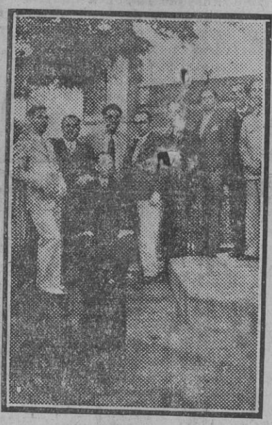
Foto obtenida al pie de la fuente situada en la plaza de Santo Domingo, de Santa Cruz de Tenerife, junto a la cual aparecen los maestros cursillistas procedentes de la Escuela Normal de Sevilla que han realizado un viaje al archipiélago canario.

Volcán en erupción Johannesburgo 26.—Por la primera vez desde hace más de veinte años, el solo volcán del Sur de África, el Duqumbane, situado al Norte del Zouvolcán, ha entrado en erupción.