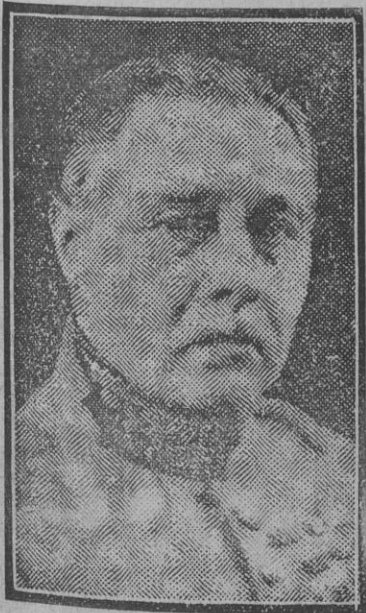
El general Gamelin ha reemplazado al general Weyand, actualmente en España, en el alto puesto de generalísimo del Ejército francés y jefe del Estado Mayor del Ejército.

Se ignoran las razones de esta acción, que se juzga algo insólita.