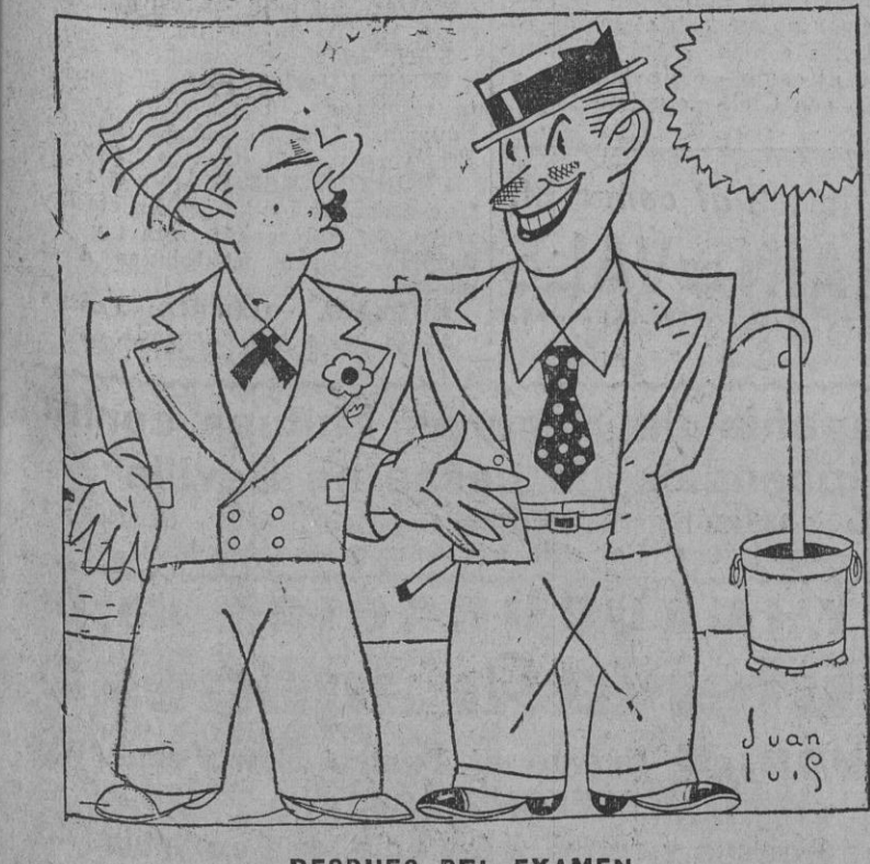
DESPUES DEL EXAMEN —Te dije que no pasaras oída do; que si aprobabas en las oposiciones, te enviaría un regalo! Segu ramente dinero, porque decía que iba a girar mucho... —Pues me ha enviado un trompo!