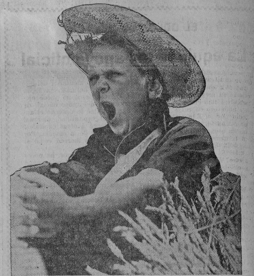
Jackie Cooper, descansa en una granja cercana á Hollywood, de las obligaciones y fatigas del estudio.

Educar un niño estrellas al que la gloria carga en brazos desde hace años, y al que millones acolaman en el mundo entero, es una de las tareas más difíciles para una madre. Se entiende, por supuesto, para una madre que quiera hacer de su hijo no un perimetre envanecido, sino un hombre hecho y derecho.