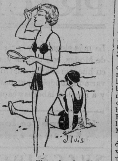
El nuevo «maillo» de «La Pinta».

En San Sebastián se juega mucho en el Frontón Ondarroz; pero don-