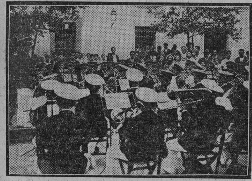
La banda municipal durante el concierto que dió en la tipida plaza de Doña Elvira.