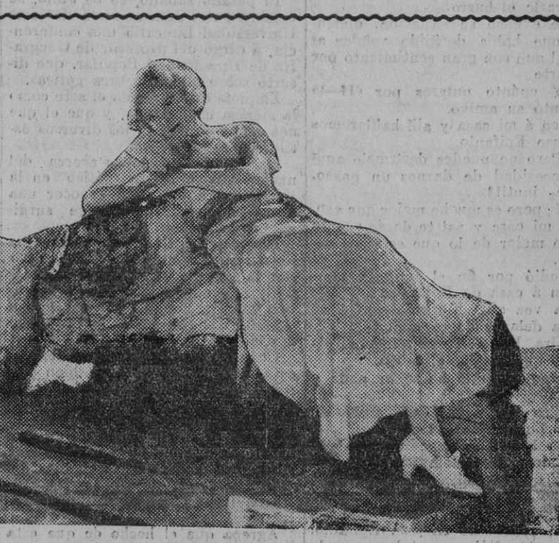
Urra Meckel, destacada actriz del cine americano.

Agosto, Mes de augurios, de malos augurios. Mes de pronósticos, de trapuestas y escarceos por sierras y playas, de sofocos, de freírse en la propia salsa, de empezar y no acabar de sudar, de dispersión; mes soporífero y anfibio. Mes en que todos seríamos anfibios si lo difícil del agua no nos afliera en una gran orden mendicante.