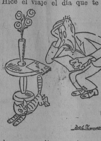
(Dibujos del mismo).