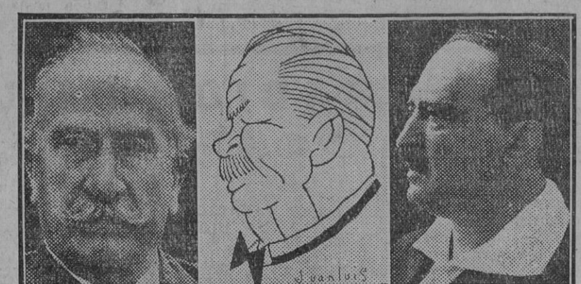
El trio que allá por primeros años del siglo significaba el espíritu revolucionario.

Tocaron en Sevilla en viaje de propaganda, en la primera década del presente siglo, Blasco Ibáñez, Alejandro Lerroux y Rodrigo Soriano. Artistas de la palabra y enarajados del ideal republicano, iban, en su deambular por ciudades y pueblos, despertando en los espíritus el más fervoroso entusiasmo por los ideales de libertad y odio irreconciliable contra el caciquismo tiránico y absorbente que aún había de seguir entronizado bastantes años.