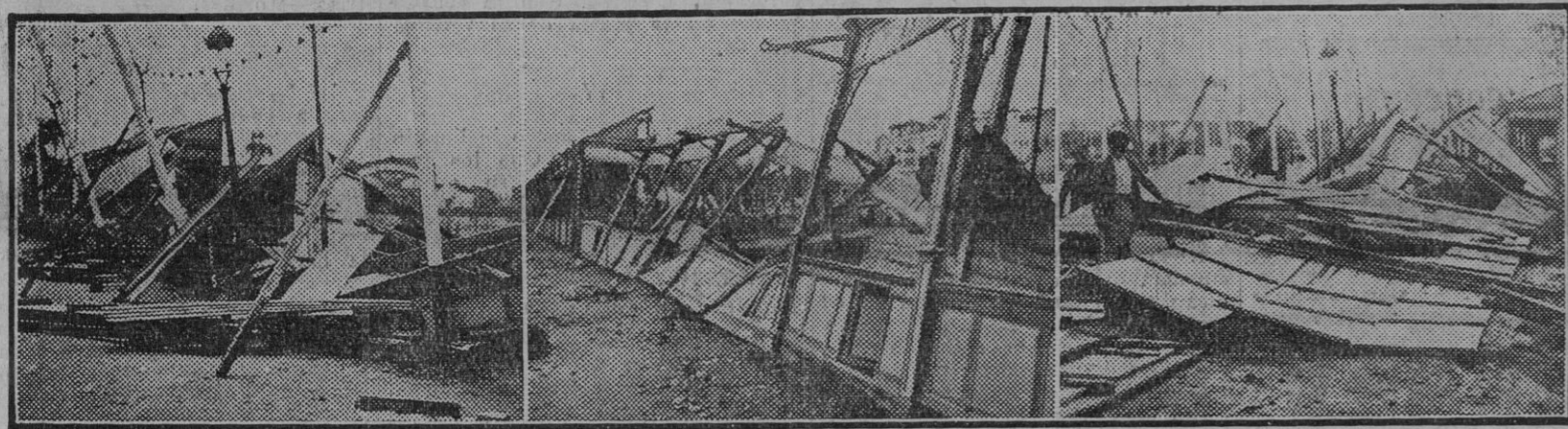
Nuestras fotos muestran el deplorable estado en que el presente temporal ha dejado los puestos de turrones y juguetes que se habían instalado en el real de la feria, Avenida de la Enramadilla. Los daños, como puede apreciarse, son de mucha consideración, retardando los trabajos que se efectúan

El viento huracanado de la noche última ocasionó destrozos en las instalaciones de la feria.—También en el arbolado y en algunas faro'as del alumbrado.—Se anegaron muchos puntos bajos de la ciudad y el río ha experimentado crecida.—Daños en el extrarradio.—El puerto cerrado á la navegación.