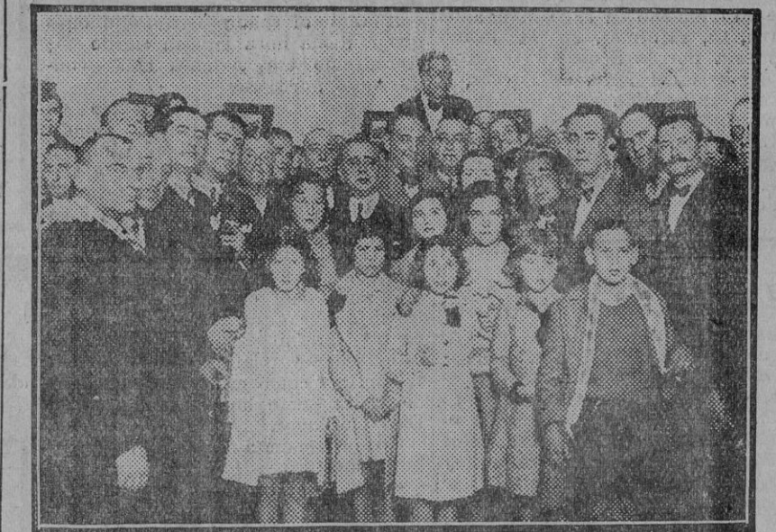
Esta sevillanísima Peña «Los Mosquitos», que con tantas simpatías cuenta en Sevilla, celebró en la noche del sábado último, de manera solemne y fastuosa, la inauguración oficial de su nuevo domicilio, situado en calle Harinas número 3.

Asisten al acto el gobernador civil, señor Díaz Quiñones, y el ex alcalde y diputado á Cortes señor La Bandera