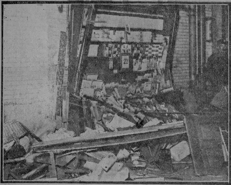
Estado en que quedó el estanco después del accidente.

A consecuencia de una falsa maniobra y por efectos de un violento choque de unos vagones contra otros, resulta aplastada y muerta la dueña del estanco de la estación