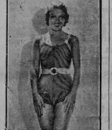
Grace Bradley, joven y esculptural artista del cinema americano