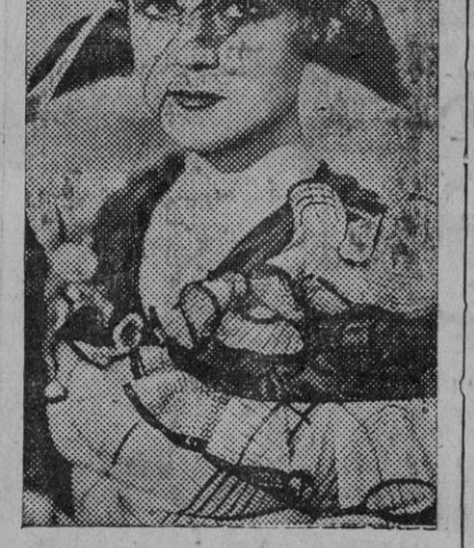
Sally Eilers, romántica del cine americano