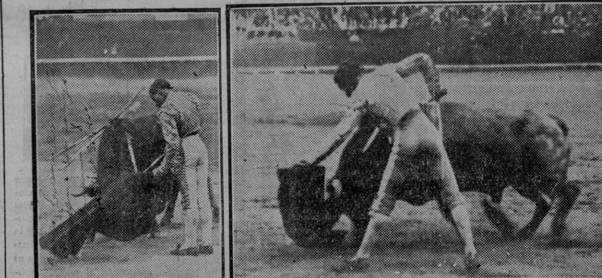
De festival taurino de la Asociación de la Prensa. — Los diestros Cagancho y El Estudiante, que tomarán parte en el próximo festival