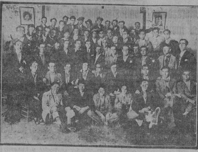
El pasado día 7, a las diez y media de la mañana, y en el Salón Británico de calle Calatrava, tuvo lugar la asamblea extraordinaria en la que había de constituirse definitivamente la Sociedad autónoma de novilleros y banderilleros de Andalucía, cuyo reglamento ya había sido aprobado por la autoridad, concurriendo al acto un gran contingente de socios y simpatizantes.

Una vez constituida la Mesa, no la Comisión organizadora se dio lectura al reglamento y se presentó un estado de cuentas, que fue aprobado por unanimidad. Posteriormente, un miembro de la Comisión organizadora dio cuenta de las gestiones realizadas para la constitución de la entidad, haciendo constar el sincero agradecimiento que ésta siente por las numerosas personas de gran relieve taurino que tanto se han interesado por la Asociación, así como por la Prensa sevillana, a la que se acordó dar un voto de gracias por su desinteresado apoyo.