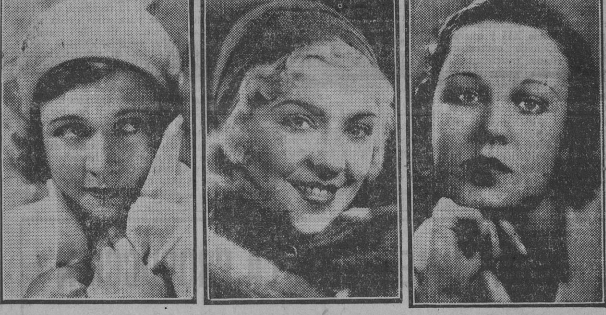
Tres jóvenes y pimpantes estrellas del cine americano: Marie Prevost, Marjorie White y Barbara Weeks

El señor Díaz Quinones volverá hoy a visitar al ministro de Obras públicas señor Guerra del Río, con el cual se ocupará de diversas obras públicas en la provincia, añadiendo que no sabía de manera cierta si regresará mañana a Sevilla, pues todo ello depende de que dé por terminadas las gestiones que realiza en la capital de la República.