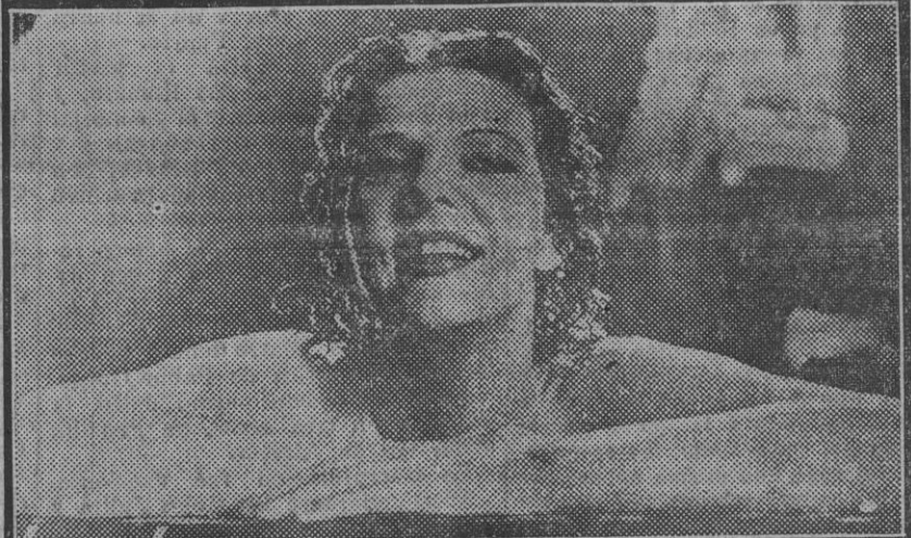
Elisa Landi, en la gran alegría de salir del baño, luminoso el rostro, ágil el cuerpo por la caricia del agua

El otro día exponíamos, un poco a la ligera, la conveniencia de instalar a lo largo, y por una y otra parte de la avenida que antes se llamó de Carlos V, prolongación de calle San Fernando, una doble hilera de bancos que servirían de reposo al paseante que por allí transita, pues en tan amplia explanada nada hay, como parecía natural, de estos accesorios, indispensables en los lugares de esparcimiento público.