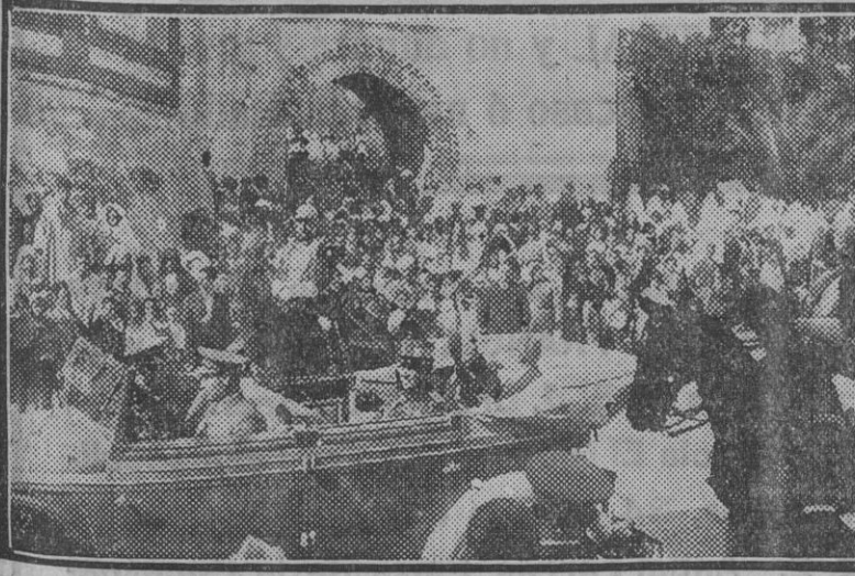
Del viaje de S. E. á Marruecos. — El Presidente con el Alto Comisario al pasar frente á la puerta de la Reina, ocupada por el público, entre el cual destaca la población árabe. (Edo. Gori.)

Este silencio de unos y este constante discursar de otros, no nos va agrandando. Seguramente que cuando los primates de los partidos no disponen ya crsa, es que de los distritos y de las