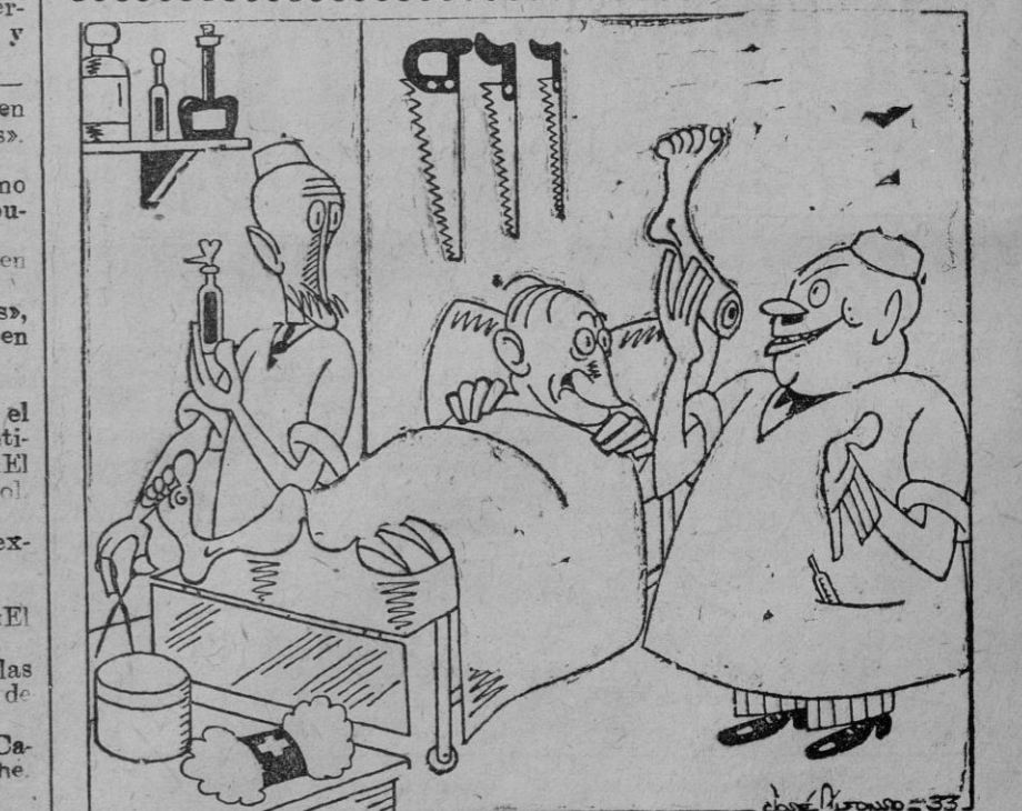
—Ya no sufrirá usted más los horribles dolores que no le dejaban vivir. —¿Y podrá dormir tranquilo? —Claro, hombre! Ahora podrá usted dormir «a pierna suelta»...

Se admiten solicitudes para el Curso 1933-34 hasta el 25 de Septiembre.