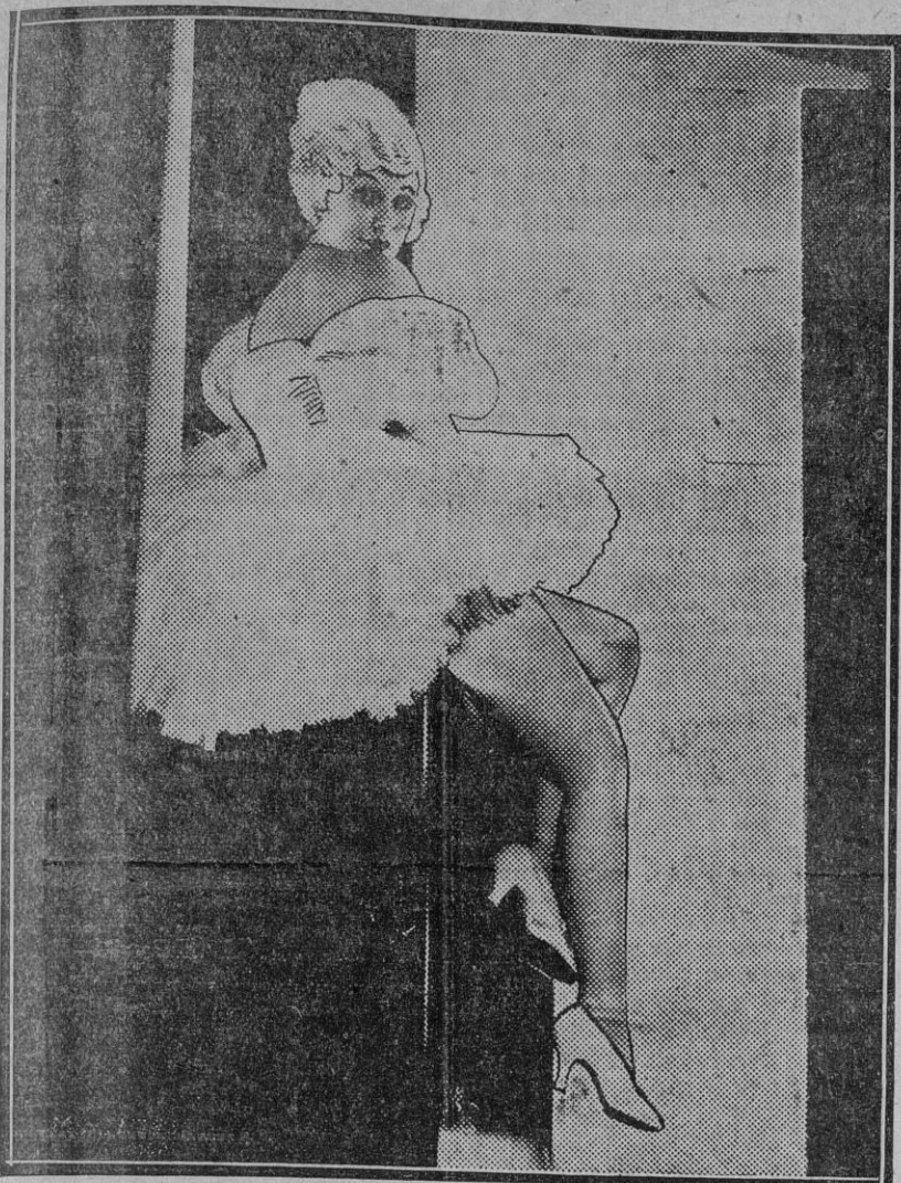
Muriel Evans, artista destacadísima en su expresa concepción de una bailarina.