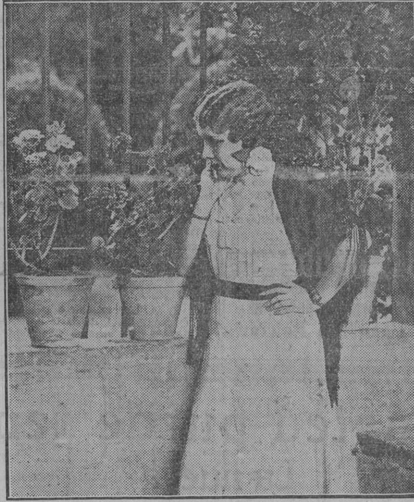
Mujer sevillana, mujer casera. Por la mañana, la peineta, la mantilla, y a misa. ¡Paseo! Ningún día. El paseo, la rueda de captores de sonrisas, no son propios de Sevilla. Para salir a la calle están los días de feria y de Samaná Santa.

Las flores del patio esperan, y que hermosos se están haciendo los claveles... Pero esa Consolación, donde se mete que no riega los geraneos dobles! El surtidor empieza su melodía. ¡Y luego dirán que los concertistas de una sola cuerda no están más que en el circo!