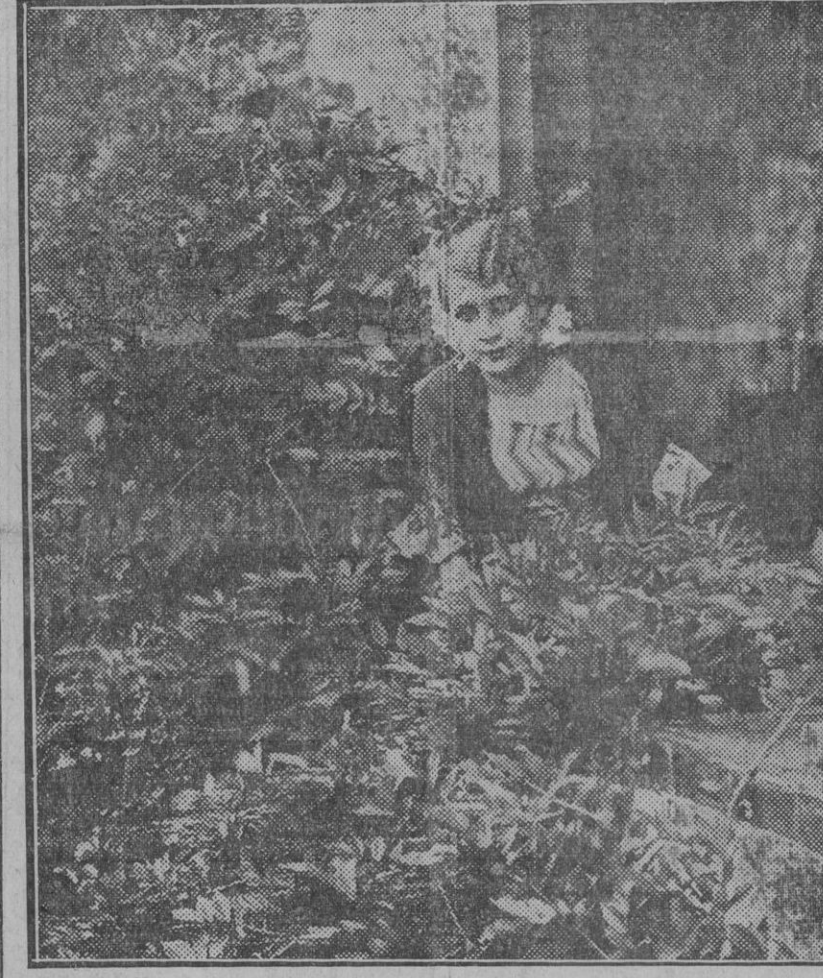
En algunas casas de Sevilla las costumbres varían un poco. Como lo han visto en la pantalla, las niñas ya salen por la tarde solas, y sin sombrero, las que lo llevan, para llamar menos la atención. Un rato de Parque, Mosconillos con la americana al brazo. Limón helado. Y golpe de teléfono en el kiosco.