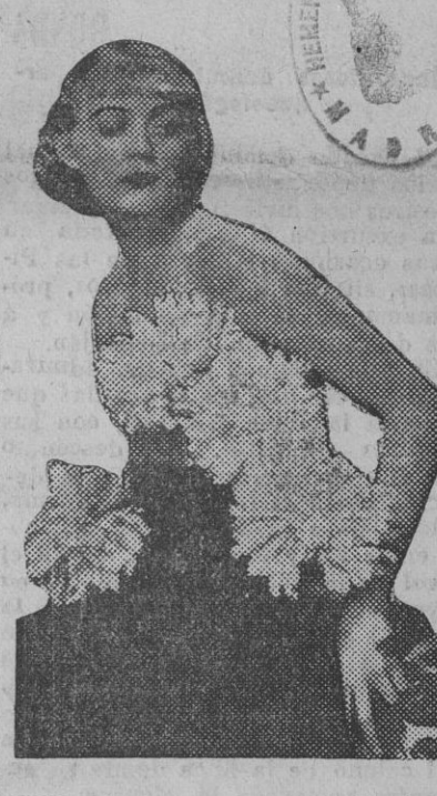
Billie Dove, cuyas personales interpretaciones está siendo muy elogiadas.

En este Centro oficial se ha recibido una comunicación de la Guardia civil del puesto de Badolosa dando conocimiento a la autoridad gubernativa que por el presidente y secretario de la Sociedad obrera La Razón, afecta a la U. G. T., se ha presentado en aquella Alcaldía el oficio de anuncio de huelga general para el día 25 del corriente mes, en el que formulan las peticiones de establecer un turno recluso en la Bolsa de Trabajo, prohibir faenas de destajo y que no se les dé colocación a los obreros forasteros mientras haya obreros parados en la localidad.