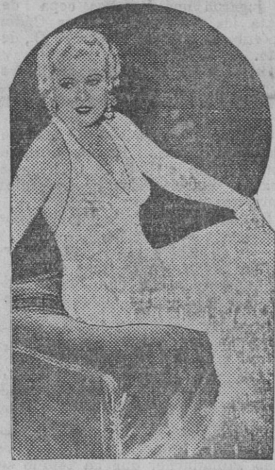
Mae West, la deslumbradora y más reciente «estrella», que parece imponer un nuevo tipo femenino en la pantalla.

Después de nuevas aclaraciones, se levantó la sesión a las dos de la tarde.