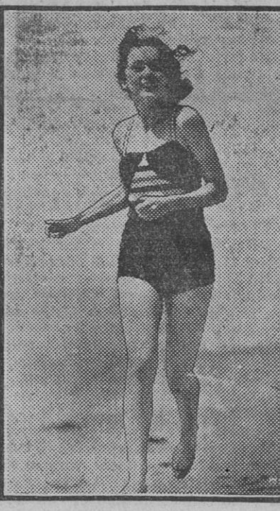
Maureen O'Sullivan disfrutando del placer de la playa con toda la alegre expresión que pone en las creaciones de sus films