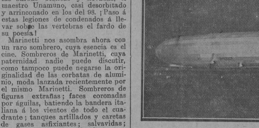
Los viajeros del zepplin acompañados de las autoridades sevillanas.

El jueves, día 18, a las siete de la tarde, dará don Elixas Torro una conferencia, en que resumirá el cursillo que viene desarrollando en el Centro de Estudios Históricos de Madrid sobre los monumentos arquitectónicos de Tierra Santa. Tratará de El Santo Sepulcro; el problema de su autenticidad. Desmonte y terraplénado de Adriano. Los hallazgos de Constantino y sus dos hijos. Reforma del patriarca Modesto y de Constantino IX Monomaco. La obra arquitectónica de los cruzados. Vistas de los santuarios del Calvario y del sepulcro. Presentará numerosas proyecciones. La asistencia será gratuita.