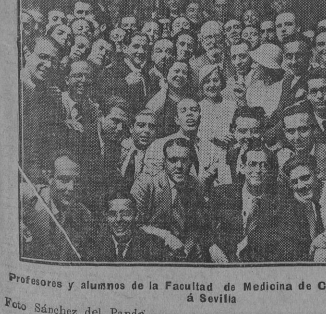
Profesores y alumnos de la Facultad de Medicina de Cádiz llegados hoy a Sevilla.