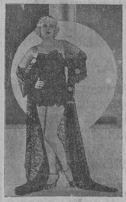
Thelma Todd, en artística deshabillé

Le ha impuesto una multa de cien pesetas, sin perjuicio de la responsabilidad judicial en que pudieran haber incurrido.