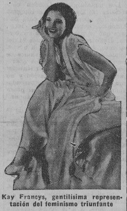
Kay Francis, gentilísima representación del feminismo triunfante