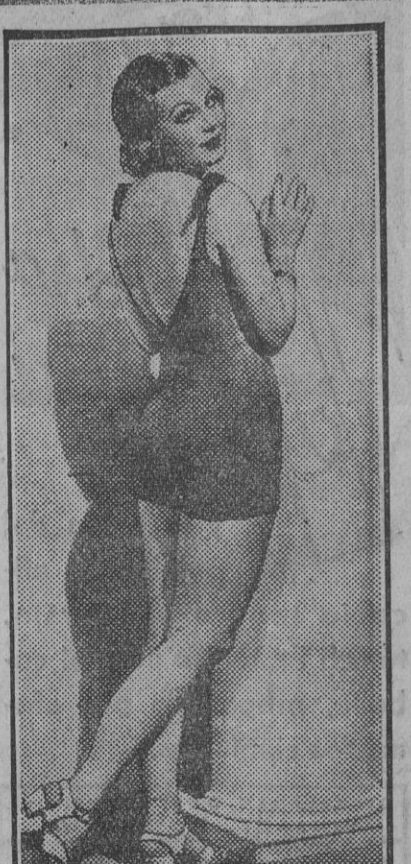
MURIEL EVANS La «star» más bella de las películas americanas