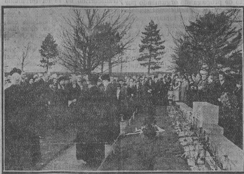
Londres.—En el cementerio de Mid dtesex. Honras fúnebres en memoria de los tripulantes del zepelin alemán abatido en Guffey ante el embajador de Alemania von Hoersch

LEA USTED TODOS LOS DIAS EL LIBERAL EL DIARIO MEJOR INFORMADO