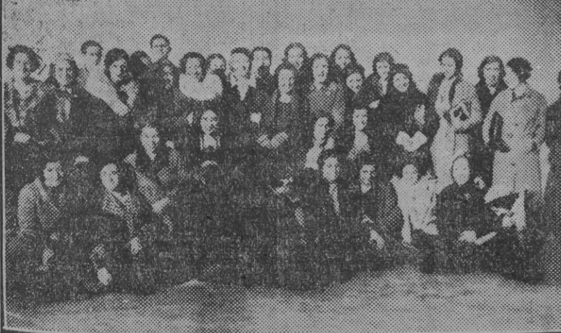
MADRID.—Señoritas alumnas de Filosofía y Letras que asistieron a las primeras clases celebradas en el nuevo edificio de la Ciudad Universitaria.

Tokio 19.—El primer ministro, M. Saito, que pasa algunos días de descanso en Hayama, ha declarado a la Prensa que no puede prever con exactitud cuál será la actitud del partido Seiyukai cuando se reúna la Dieta el 21 de Enero, aun cuando entiende que esa actitud ha de ser menos intransigente que antes. Con respecto a la cuestión de Jehol, dijo el primer ministro que el mariscal Tchang Sue Liang acumulaba tropas en las cercanías de dicha ciudad, por lo que el Japón debía estar dispuesto a todo. Por el momento, añadió, las tropas niponas que se encuentran en Manchuria son suficientes para reprimir los pequeños levantamientos que puedan crear las operaciones de China.