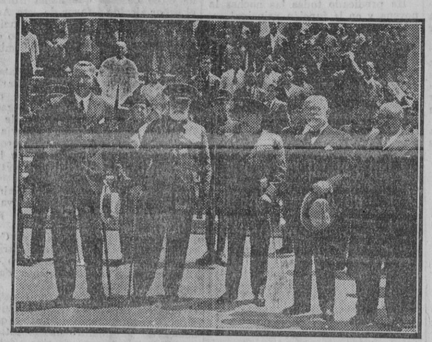
El general Cabanellas, director general de la Guardia civil, acompañado de las demás autoridades, presenciando el desfile de las fuerzas.