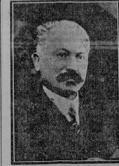
M. Albert Lebrun, el más probable sucesor de M. Paul Doumer, en la Presidencia de la República vecina