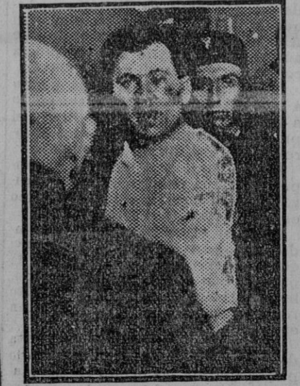
El agresor del Presidente de la República francesa poco después del atentado, tal como le dejaron los que presenciaron el criminal acto