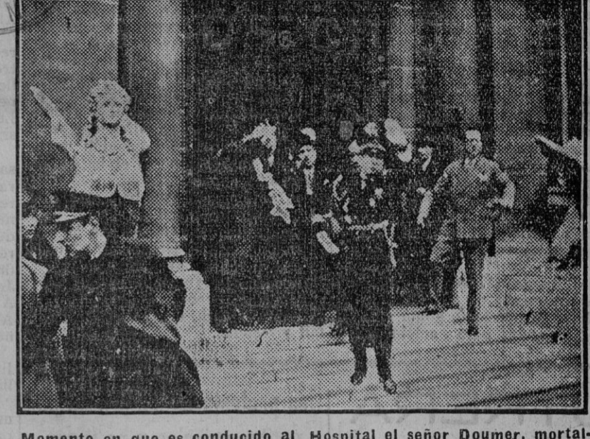
Momento en que es conducido al Hospital el señor Doumer, mortalmente herido