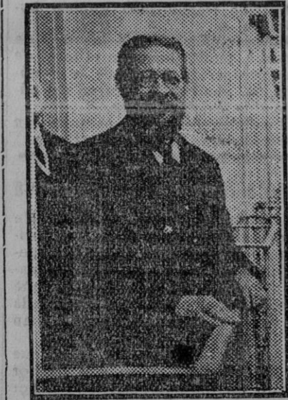
Mr. Albert Thomas, líder socialista belga, presidente del Comité Internacional del Trabajo, que ha fallecido en París

El Juzgado de guardia ordenó el traslado del cadáver al departamento Anatómico, pasando las diligencias al Juzgado del Salvador.