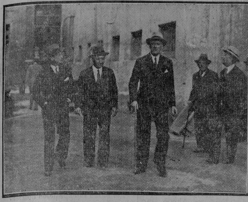
El señor Casares Quiroga visitando la fábrica de Los Rosales.