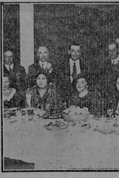
«Lunch» con que fué obsequiado el ministro en la fábrica de Los Rosales.