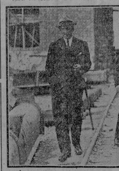
«Lunch» con que fué obsequiado el ministro en la fábrica de Los Rosales.