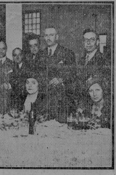
«Lunch» con que fué obsequiado el ministro en la fábrica de Los Rosales.