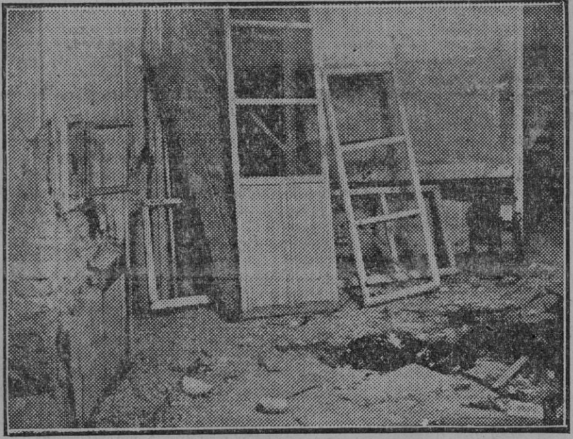
Aspecto que ofrece el patio de la casa de calle Santa Ana, donde anoche explotó un petardo (Fdo. Gori.)

ESTE NÚMERO DE El Liberal CONSTA DE OCHO PÁGINAS