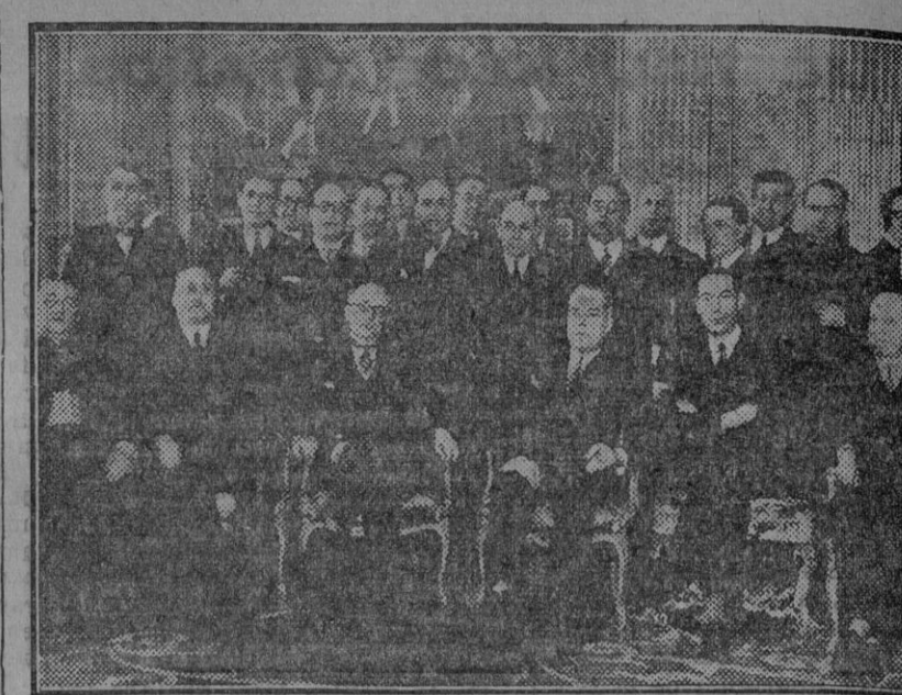
En la Embajada española de París se celebra con gran brillantez el primer aniversario de la República. El embajador de España en París, Sr. Madariaga, ha reunido el día 14, en la Avenida Georges V, a todos los presidentes de las Sociedades y Agrupaciones españolas en Francia, para conmemorar el primer aniversario de la proclamación de la República española (Fdo. Gor.)