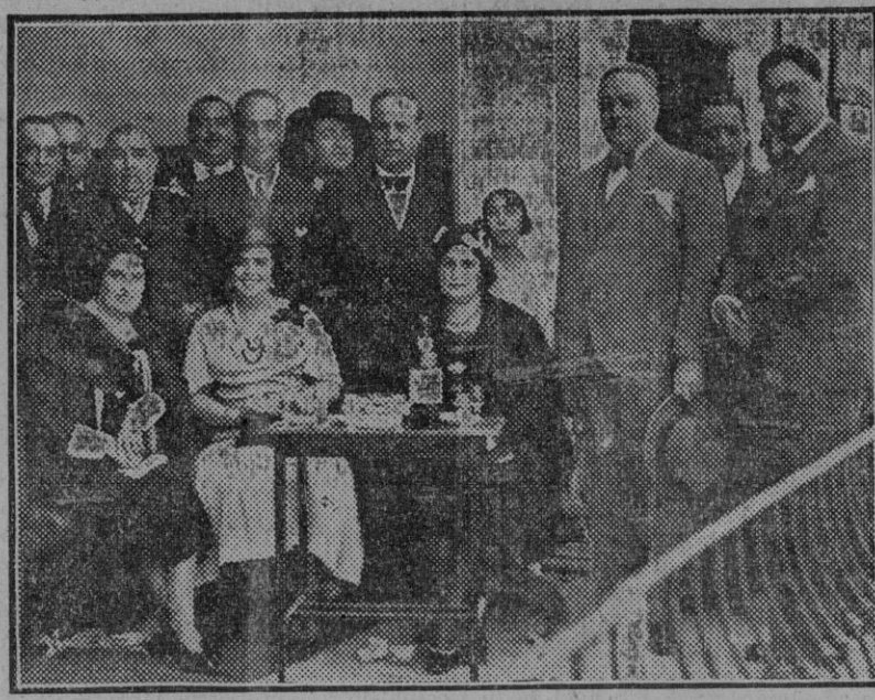
El ex ministro Sr. Martínez Barrio con un grupo de correligionarios y amigos en la caseta del partido radical

A las ocho de la mañana de hoy un fotógrafo tomaba las últimas vistas de una caseta. Era ésta la de la Tertulia del Arenal, donde los socios aún no han despedido la feria.