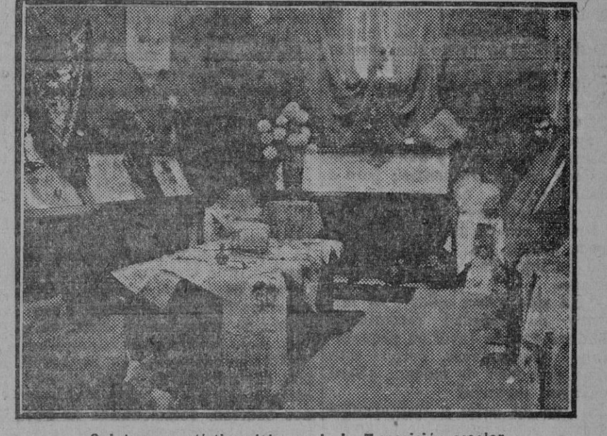
Saleta con artísticas labores de la Exposición escolar

Los vehículos que a la salida de los toros se dirijan a la feria, lo harán por el itinerario siguiente: Paseo de Cristóbal Colón, Avenida de las Delicias, Plaza de América, a salir por delante de la Plaza de España a la feria.