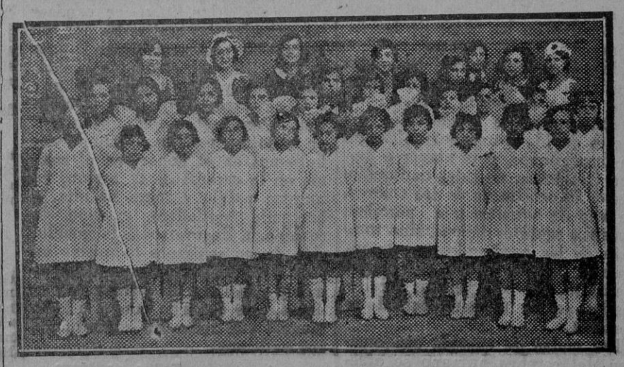
Festival celebrado en el teatro de la Exposición, al que asistieron las niñas de las escuelas nacionales