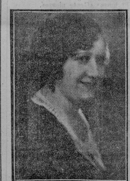
La eminente soprano Conchita Olivera, que ha triunfado brillantemente en los recitales dados en la Sociedad Sevillana de Conciertos.

La Compañía de ferrocarriles de Madrid, Zaragoza y Alicante, accediendo á la petición formulada por nuestro Ayuntamiento, va á establecer con motivo de las próximas fiestas un servicio especial de ida y vuelta á Madrid en tercera clase, agregándose para estos aspectos un coche de la indicada clase, con capacidad de noventa plazas al expreso de lujo.