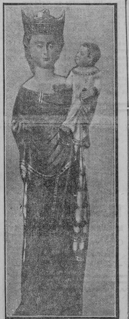
La peregrina imagen de Nuestra Señora de la Hiniesta, patrona del Ayuntamiento de Sevilla, joya artística de imponderable valor, perdida en el siniestro al ser pasto de las llamas.