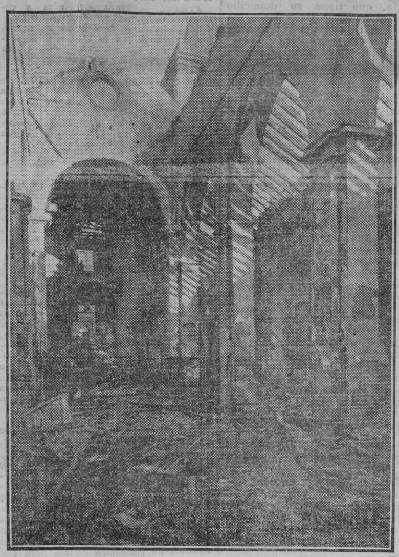
Estado en que ha quedado la nave central del templo de San Julián

El revuelo estudiantil de esta mañana... Prosiguió el gobernador su conversación con los periodistas, significándoles que esta mañana se ha registrado un pequeño revuelo estudiantil en calles Rioja y Universidad, que fue inmediatamente disuelto, agregando que como mañana se celebra una fiesta por parte de uno de los bandos de estudiantes, hace público el ruego de que nadie interrumpa los actos que en uso de su perfecto derecho celebran unos u otros, en evitación de que la autoridad tenga que actuar tan energicamente como sea preciso.