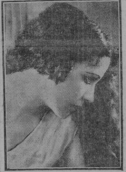
Rosita Moreno, la famosa estrella de la pantalla.