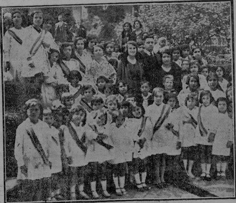
Visita al Alcázar de las niñas del Colegio Nacional del Cerro de la Aguilera. (Foto. Sánchez del Pando). (Fdo. Gori.)

El señor Fontanes continuaba hoy practicando diligencias en dicho pueblo.