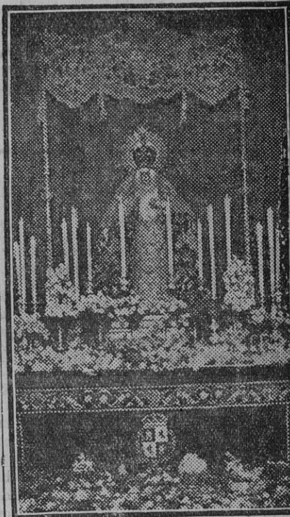
La imagen de la Virgen de la Esperanza de la Macarena, expuesta á la veneración de los fieles en la iglesia de San Gil.

Por el viceconsul de Noruega en Sevilla, señor Borge, recibimos el programa del banquete y de la fiesta que tuvo lugar en Oslo el pasado día 10 de Marzo en el Centro Hispano-Noruego, el cual es el siguiente: «Fiesta de inauguración celebrada en Oslo el día 10 de Marzo de 1932, en el Hotel Bristol. PROGRAMA: 1.º Allocución del presidente, señor Magnus Gronvold. 2.º Conferencia del excelentísimo señor don Felipe García-Ontiveros y Laplana, ministro de la República española. 3.º Canto de la cantatriz señora Angélica Blikstad Bang: a) «La Mantilla», música de Alvarez. b) «Amor y Odio», música de Granados. c) «Paño murciano», música de Joaquín Nin. d) «El Vito», música de Joaquín Nin. 4.º Concierto por el pianista Waldemar Alme: a) Granados: Dos danzas españolas. b) Albéniz: «Granada» y «Austurias» (Leyenda). 5.º Bailes españoles ejecutados