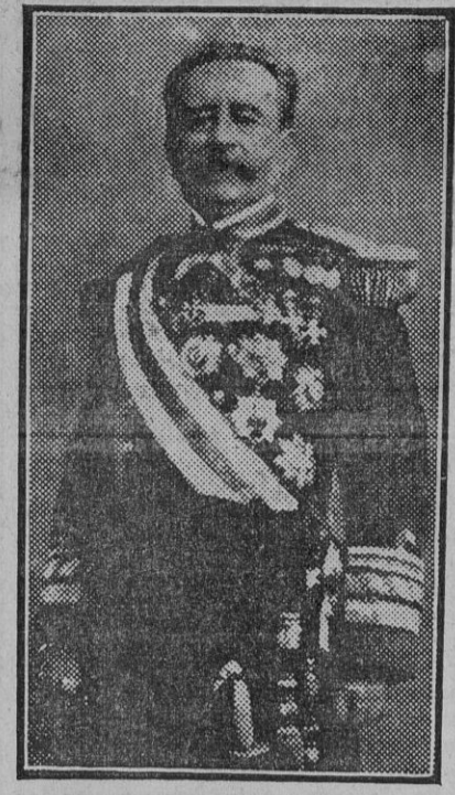
El vicealmirante de la Armada don Antonio de Eulate y Fery

Con este objeto, y para aclarar lo que haya de cierto acerca del particular, he llamado al hermano mayor de la citada cofradía.