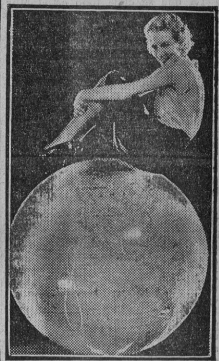
La bellísima Karen Morley dominando el mundo con el prestigio de su arte

Su deseo sería el poder atender á todos, hasta en el más mínimo detalle; pero ni tiene tiempo, ni sitio, ni resistencia física, como ya ha dicho, para poder complacer á todos.