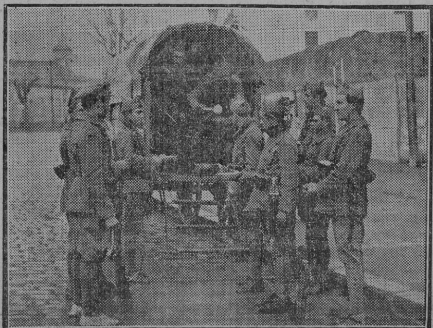
La Intendencia repartiendo el rancho á los soldados que prestan servicios en los puntos estratégicos (Fdo. Gori.)