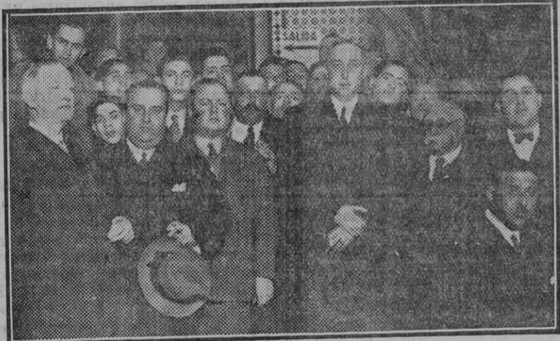
El conde de Rodezno, acompañado de un grupo de correligionarios, después de su conferencia de ayer.