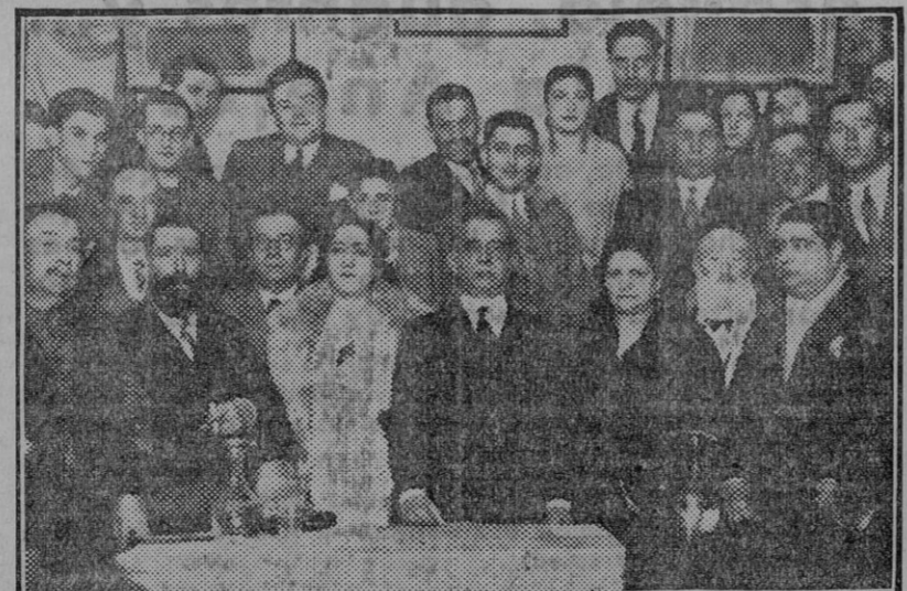
Acto celebrado en el Centro Republicano del octavo distrito en el que tomaron parte el alcalde, la señora Alvarez de Burgos y otros oradores.

El entierro de las víctimas de los sucesos promete constituir una imponente manifestación de duelo. En la presidencia, además del general Sanjurjo y del presidente de la Diputación de Madrid,