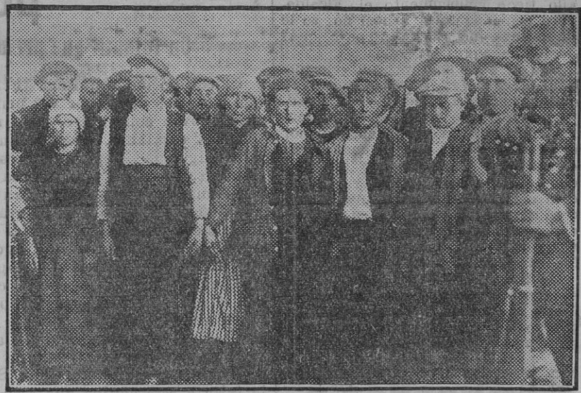
CASTILBLANCO.— Los principales acusados como autores de los asesinatos, al ser conducidos por la Guardia civil.