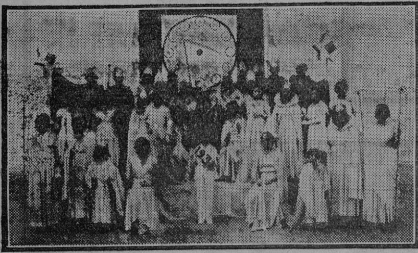
Fiesta de la Noche Vieja celebrada en el pabellón de Castilla la Vieja y León, por las colonias castellano-leonesas. (Fdo. Gori.)