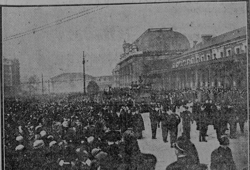
Imponente manifestación de duelo a que dió lugar la conducción de los restos de Arnaldo Mussolini, hermano del Duce italiano. La fotografía muestra el momento de pasar la comitiva fúnebre por delante de la estación de Milán.