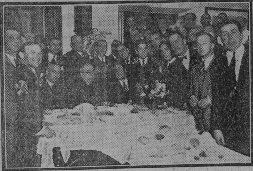
El jefe del Gobierno, Sr. Azaña, en el Casino de Acción Republicana, durante el «luncheon» con que le obsequiaron los directivos del partido.

Por su parte, Vithalhai-Patel, oficial de Gandhi, ha declarado que habiendo fracasado la tercera Conferencia de la Tabla Redonda, la India caminaba derecha a la revolución, y que la lucha por la libertad era ya inevitable. Como primera manifestación de la rebeldía preconiza el «choicotage» de las mercancías británicas.