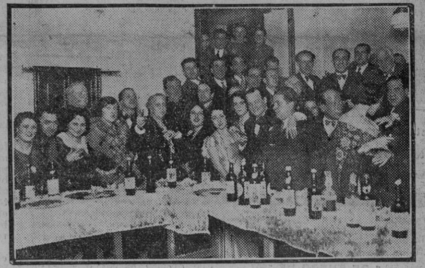
Como todos los años, la Asociación de la Prensa congregó en sus salones a lindísimas artistas y otros invitados de calidad para recibir el nuevo año.

Ramón Martínez Cebrián. Sevilla, Enero, 1932.