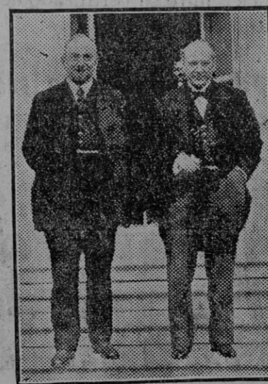
Chicherin, el antiguo ministro de la República soviética que actualmente se halla en la mayor miseria vagando por las calles de Moscú.

Roma.—Comunican de Génova a los periódicos que en Gornikhan (Liguria) se ha hundido un palacio de seis pisos, en construcción. Seis personas han resultado muertas y otras cuatro heridas.