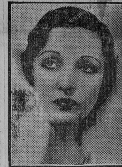
Alice Joyce, astro del cine, dueña de los públicos de Yanquilandia.

Ninguna ciudad de España tan combatida en el tránsito del acabamiento de un régimen y el amanecer del nuevo. La postguerra no había dejado sentir sobre la ciudad su paralizante aliento. De una parte el alzado derroche de la Dictadura, que nos hizo vivir la ficción de una grandeza impresionante é imprevisita; de otra, la locura de la Exposición, poniendo fuera de su sitio todas las actividades de la ciudad, que, desbordadas de sus naturales y positivos cauces, vendrían a poner en peligro, más tarde, su ritmo progresivo y su economía desarticulada.