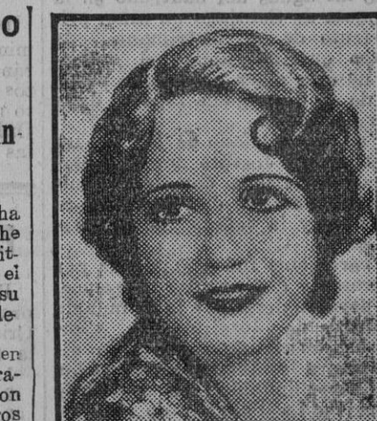
Wynne Gibson, estrella de la pantalla con brillo de primera magnitud.

El importe de lo robado asciende á un millón doscientos cincuenta mil francos. Aunque la Policía fué prevenida al punto por teléfono, hasta ahora nada se ha podido descubrir del paradero de los ladrones.