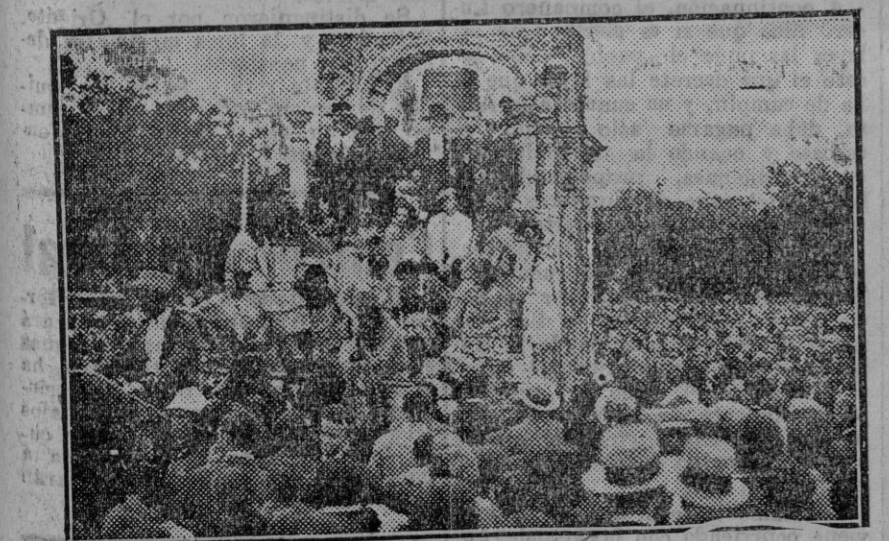
MADRID.—Carroza de Andalucía en la cabalgata celebrada con motivo de las fiestas de la República. (Fdo. Gori.)

Es una tendencia que se marca más este año. En 1873 se advirtieron síntomas parecidos. Internos los ricos emigran, la Andalucía ardiente espera bajo el sol. —Yo no creí que la República era esto. —Ah, vamos, usted creyó en un parto sin obstetricia, en un tránsito tan jeso, en una metamorfosis sin emoción y sin dolor. —¿Quién tiene la culpa de que los contumaces errores del país hagan casto indispensable una Convención? —Orden! —Justicia! —Tranquilidad! —Pues de eso se trata. —Pero, para conseguirlo que no sean los que más tocan el clarín los que,