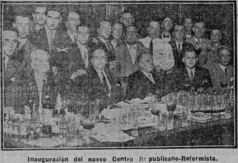
Inauguración del nuevo Centro Republicano-Reformista.

LEA USTED MAÑANA «EL LIBERAL» EL DIARIO MEJOR INFORMADO