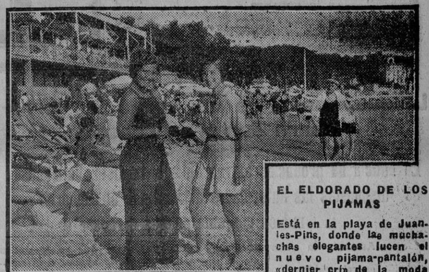
EL ELGORADO DE LOS PIJAMAS

Candidaturas: O'Donnell 11 principal, altos Café París.