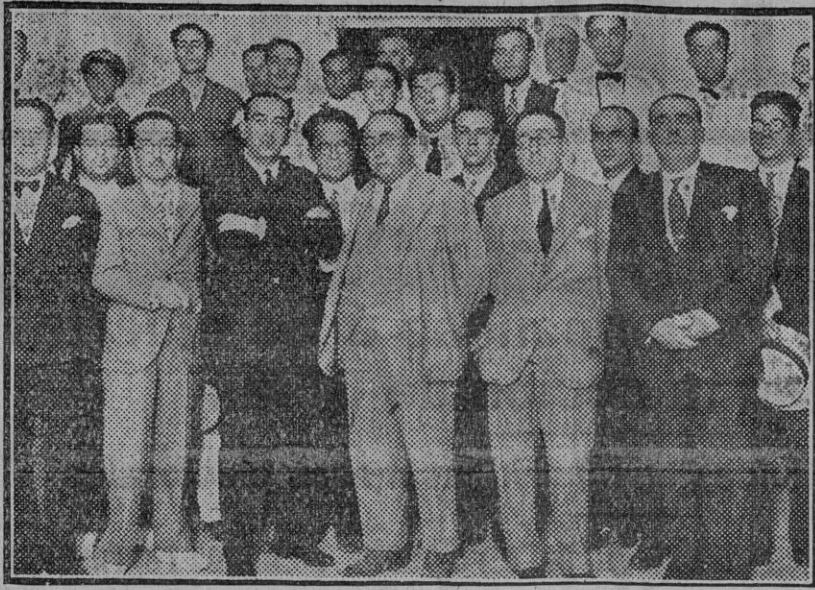
Algunos de los oradores que anoche hablaron en pro de la candidatura del comandante Franco.