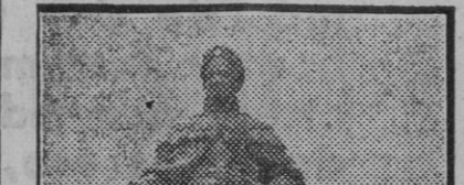
VI VA LA VIGILANCIA MUESTRAN LOS REPOSICIONISTAS