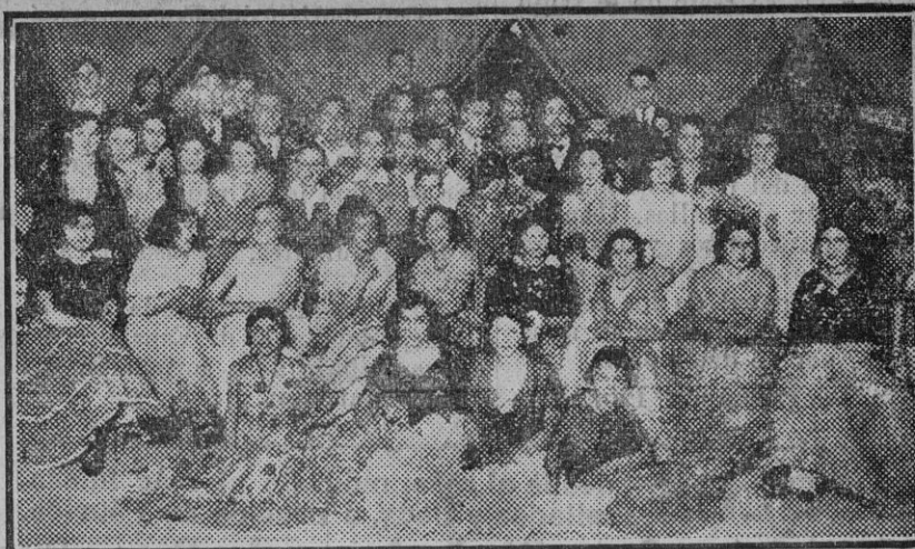
Grupo de lindísimas muchachas concurrentes á la caseta del Mercantil

También ha sido muy visitada la exposición de pinturas del artista extremeño señor Acosta, mereciendo grandes elogios las obras que presenta.