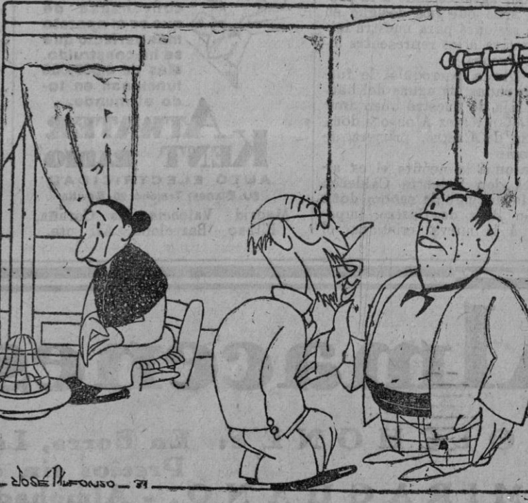
—Su mujer está muy débil y extenuada. Hace trabajos muy duros, ¿verdad? —Al contrario, doctor! Se pasa el día haciendo almohadones y colchones.

A todos los afiliados, simpatizantes y jóvenes obreros y obreras en general: El domingo 26, a las nueve de la noche, en el local de la Federación Tabacquera, Anorra, 5, se celebrará una Asamblea general para la constitución de esta agrupación, sujeta al siguiente orden del día: