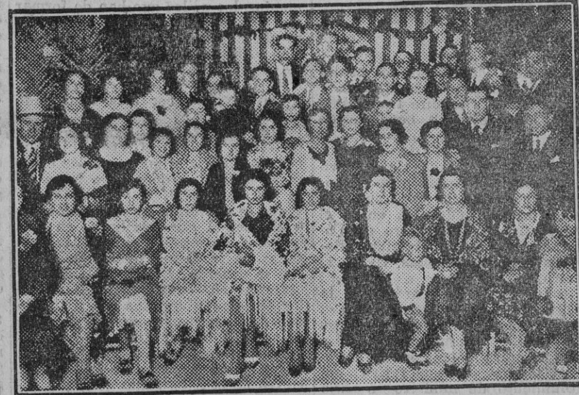
La típica caseta de San Bernardo, preferida por los clásicos