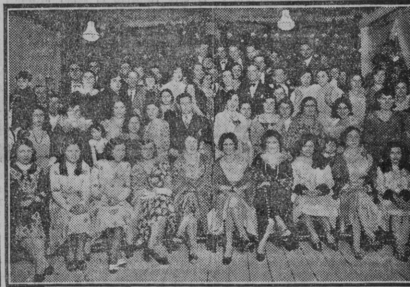
La caseta de la Casa de la Morlaña, una de las más animadas y concurridas de la presente feria