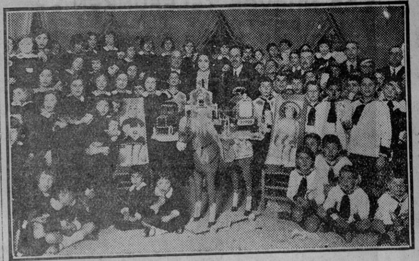
Reparto de meriendas y juguetes a los niños de las casas de Beneficencia por el Círculo Mercantil en la caseta de la FERIA.