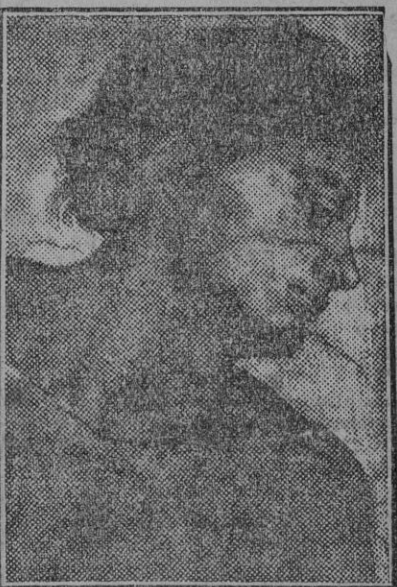
sen extraídos los mármoles necesarios para erigir el monumento; y, a este efecto, le hizo entregar mil ducados. Miguel Angel permaneció más de ocho meses en esas montañas, con dos servidores y unos cuantos caballos, sin otras provisiones que las de boca. Un día, contemplando el paisaje desde lo alto de un monte de gran elevación sobre el mar, le vino la idea de hacer un coloso que los navegantes pudieran ver desde alta mar. Sin duda, a ello era estimulado por la comodidad que presentaba esta limpia y enorme masa de mármol que podría trabajar a su gusto. A ello era estimulado también por los Antiguos, que para producir quizás el mismo efecto que Miguel Angel, ó para huir de la ociosidad en la montaña, ó por cualquier otra razón, es lo cierto que restán algunos recuerdos imperfectamente bosquejados, que dan un buen ejemplo de su manera. Y, ciertamente, habría realizado este proyecto si el tiempo ó la empresa a la cual se había comprometido se lo hubiesen permitido; y yo se lo he oído, un día, lamentarlo amargamente. Cuando hubo terminado la extracción y la elección de los mármoles que le parecían suficientes, y una vez conducidos al puerto, ceja allí un hombre que vigilará el campamento, y se vino a Roma. Cuando llega a esta ciudad, después de haberse detenido algunos días en Florencia, se encuentra allí, en el muelle, una parte de los mármoles. Los hizo transportar a la plaza de San Pedro, detrás de Santa Catalina, donde el artista tenía su taller, pasado el corredor de los mármoles colocados sobre la plaza, eran la admiración de la gente y la alegría del Papa. Este favoreció a Miguel Angel hasta el extremo que, habiendo el artista comenzado su obra, muchas veces el Papa iba a buscarlo a su casa, conversando con él, como con un hermano, de la construcción de su tumba y de otras cosas referentes a arte. Para hacer esto más cómodamente, el Papa había hecho tender, del corredor a la casa, un puente colante sin ser visto. Manuel F. de los Rofos.