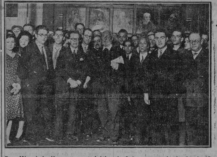
Don Miguel de Unamuno, catedrático de Salamanca, rodeado de significadas personalidades del Ateneo de Madrid, después de su conferencia sobre «Simón Bolívar, libertador de España», en la que intercaldó duras frases contra el Monarca actual y su reinado. (Fdo. Gori.)