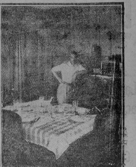
El gran actor de cine Buster Keaton, en la intimidad de su hogar, preparando fuerzas para su artística labor.