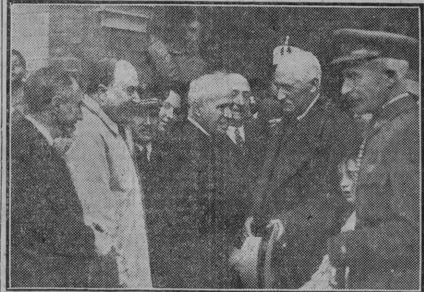
El infante don Carlos conversando con la representación del Municipio que acudió á recibirle. (Foto. S. del Pando). (Fdo. Gori).