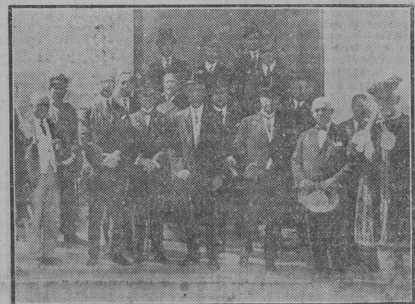
SANLUCAR.—El Ayuntamiento bajo mazas en el solemne homenaje á la memoria del gran dramaturgo Luis Eguilaz, con motivo del centenario de su nacimiento