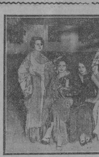
Las Reinas de la belleza de los distritos de Madrid.