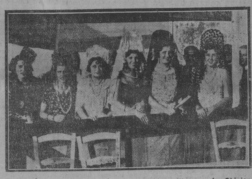
Bellísimas señoritas de la buena sociedad sevillana y de Chipiona, que presidieron el festival taurino celebrado el domingo en la linda playa de la Cruz, con un fin benéfico.