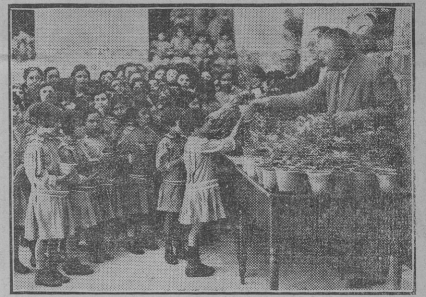
Comisionados de la Sociedad protectora de animales y plantas reparando macetas entre las niñas del Hospicio.

Las derechas dicen que el proyecto del señor Turner es confiscar a la Nación todos sus bienes sin compensación alguna.