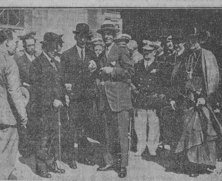
El ministro del Trabajo, a su llegada a Sevilla.

Le acompañan el Subsecretario del Ministerio y el secretario auxiliar