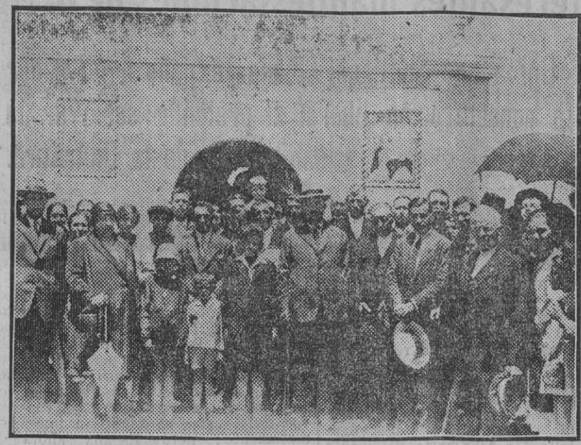
CASTILBLANCO DE LOS ARROYOS. Las autoridades con la madrina, después de la bendición de la nueva fuente.

Enviamos gratuitamente nuestro folleto especial, muy práctico, muy ameno y muy ilustrado.