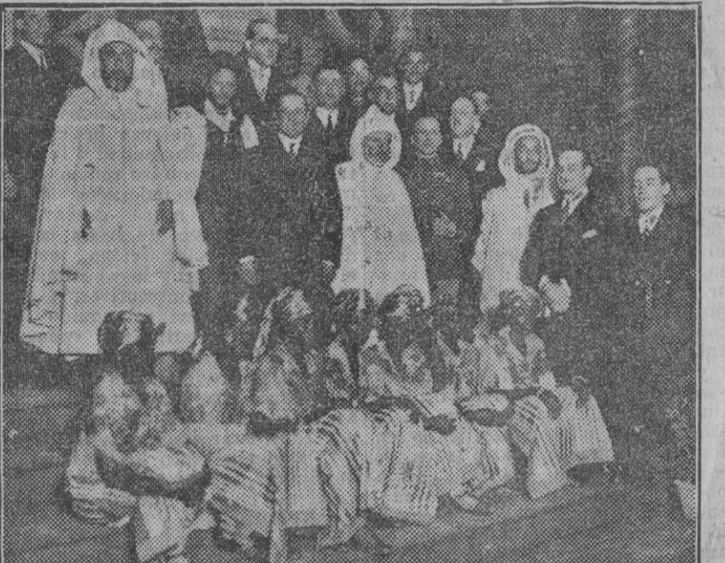
Recepción celebrada en el pabellón de Guinea con motivo de la semana de Guinea y Marruecos.