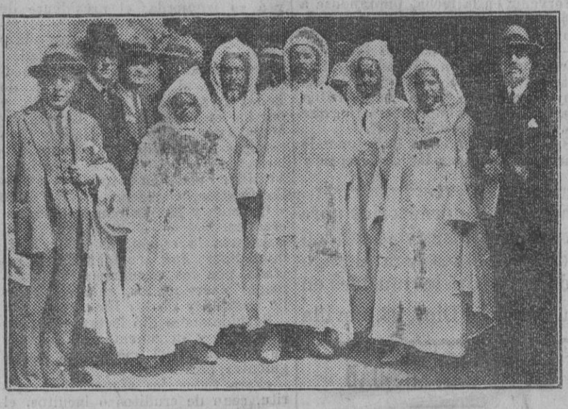
Moros notables que se encuentran en Sevilla con motivo de la semana de Guinea y Marruecos.

DEGUSTACION DE PRODUCTOS COLONIALES Terminada la conferencia del señor Bravo Carbonell, los invitados pasaron a una de las salas de exposición, donde fueron servidos, para su degustación, productos coloniales—café y chocolate elaborado exclusivamente con cacao de la Guinea—y otros de nuestro país. A esta hora de la degustación aumentó extraordinariamente la concurrencia, como ha venido sucediendo en todas las ofrecidas por los distintos países concurrentes al Certamen, haciendo verdadera y difícil el acceso a las mesas. También los elementos indígenas de la Guinea tuvieron su merienda de negros. POR LA NOCHE.—UNA COMIDA EN EL PABELLÓN MARROQUÍ A las nueve de la noche se celebró en el pabellón marroquí la comida oficial que ofrecía el delegado