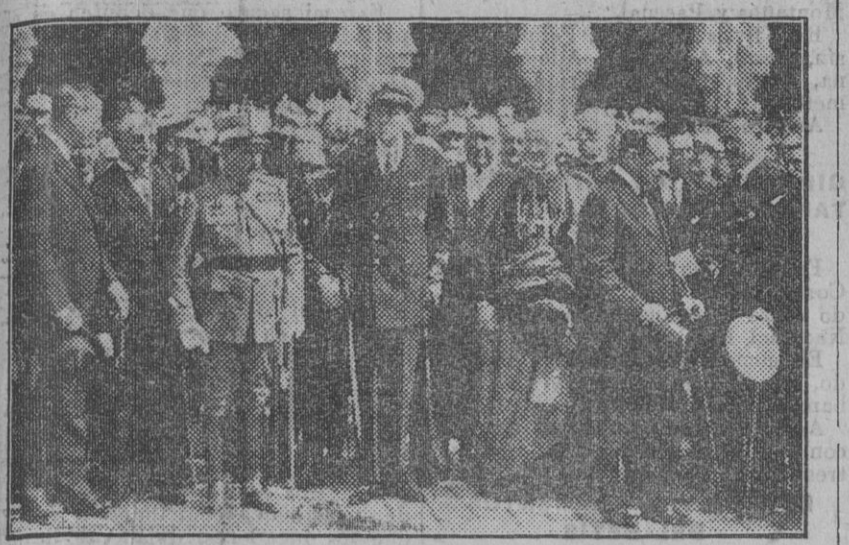
El príncipe de Asturias al salir de la estación.