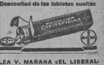
LEA V. MAÑANA «EL LIBERAL»

Contra todos los dolores... Sus efectos son también insuperables en las neuralgias, dolores de muelas, de oídos y de las sienas, así como también en los que acompañan a las molestias periódicas de las mujeres.