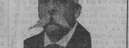
La suscripción pública