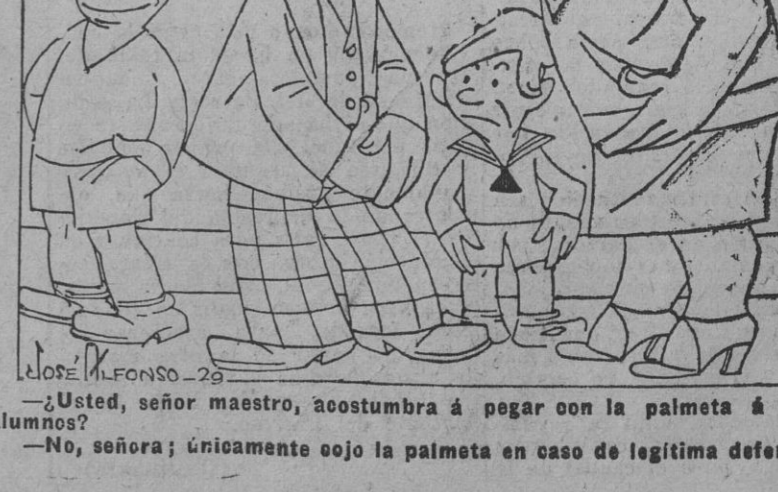
—Usted, señor maestro, acostumbra a pegar con la palmeta a sus alumnos? —No, señora; únicamente en caso de legítima defensa.

NO SE PERMITE ARROJAR TINTEROS AL PROFESOR