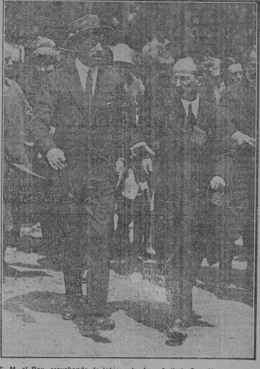
C. M. el Rey, escuchando de labios de don Anibal González, sobre el terreno, las explicaciones de aquél acerca del proyecto de la gran basílica de la Milagrosa, el día en que don Alfonso colocara la primera piedra del futuro templo.