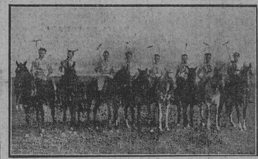
En terrenos de Pinado. Equipos que jugaron el primer encuentro oficial de polo, formados los «verdes» por los oficiales de Caballería de Alfonso XII...

Este número de EL LIBERAL consta de 6 páginas