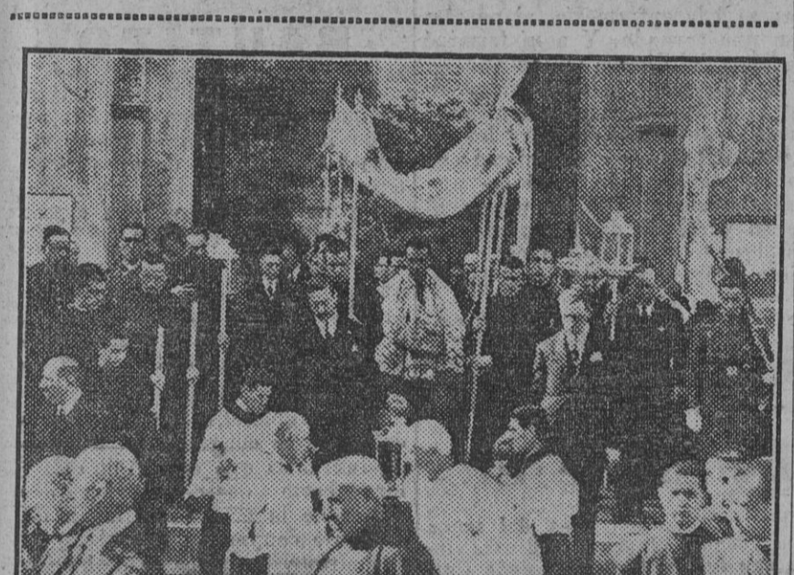
La procesión de S. D. M. de la feligresía del Sagrario, al salir por la Puerta del Perdón, de la Catedral.

Si la Compañía Sevillana de Tranvías por su sola iniciativa no puede llevar a efecto este proyecto, tan indicado por el ensanche de la ciudad hacia la carretera de Dos Hermanas, será cosa de pensar en que se lleve a término con el auxilio del Estado o del Municipio, pues ambos organismos se habrán de beneficiar con la nueva línea.