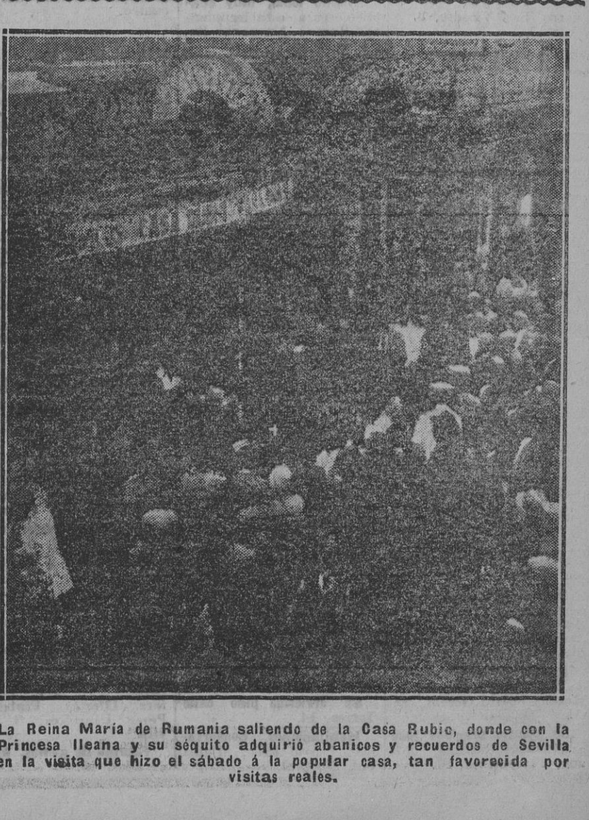
La Reina María de Rumania saliendo de la Casa Rubia, donde con la Princesa Ileana y su séquito adquirió abanicos y recuerdos de Sevilla en la visita que hizo el sábado a la popular casa, tan favorecida por visitas reales.