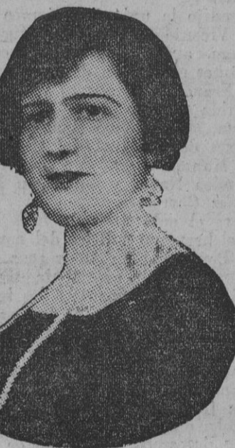
DE NUESTRO CONCURSO DE BELLEZA. Número 168.—LLERENA. Lema: LLERENERA SOY.

Acerca de los aficionados que se lanzan al ruedo durante las corridas